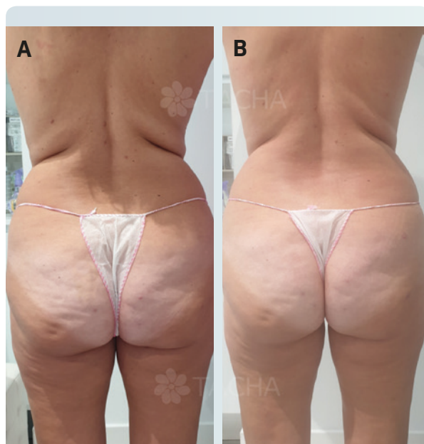
Figure 2. (A) Photo de dos de la patiente avant et (B) après le traitement. Une redéfinition/réduction du contour des cuisses, des flancs et de l'abdomen a pu être observée.